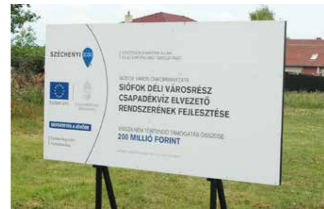
500 millió forint önerőt kellene hozzátennie a városnak...

Nem véletlen, hogy a Balatoni Szövetség is hallatta hangját: „A kormányzati intézkedések megítélésünk szerint bennünket, az elsősorban turisztikából élni szándékozó településeket, így a Balaton-parti önkormányzatokat lényegesen komolyabban terhelnek” - írta Lombár Gábor, a szövetség elnöke a Gulyás Gergely miniszternek küldött levélben, kiemelve a kurtaxa után eddig járó állami kiegészítés jövő évi megszün-