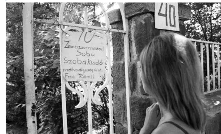
Zimmer Frei anno

Az önkormányzati adóhivatal ismételten felhívja a szállásadók figyelmét: az idegenforgalmi adót ugyan idén nem kell befizetni, de be kell vallani. Az önkormányzati adóhatóság tájékoztatójából idézünk: „Kormányrendelet alapján az idegenforgalmi adó fizetési kötelezettségét április 26. és december 31. között felfüggesztették. A szálláshely-üzemeltetőnek nem kell idegenforgalmi adót beszélnie, így azt továbbfizetnie sem az önkormányzatnak. Fontos azonban tudni, hogy az egyébként megállapí-